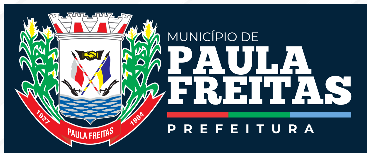
Em fundos coloridos