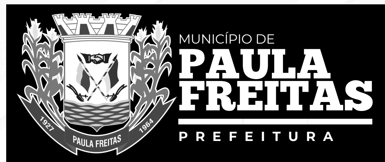
Em fundo preto