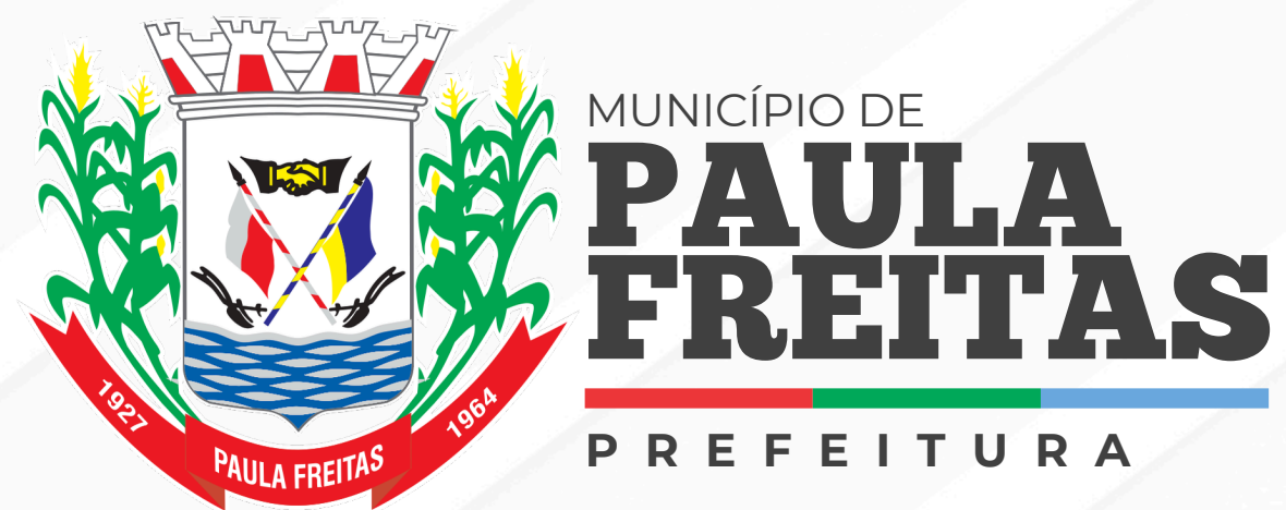
Versão horizontal (padrão)